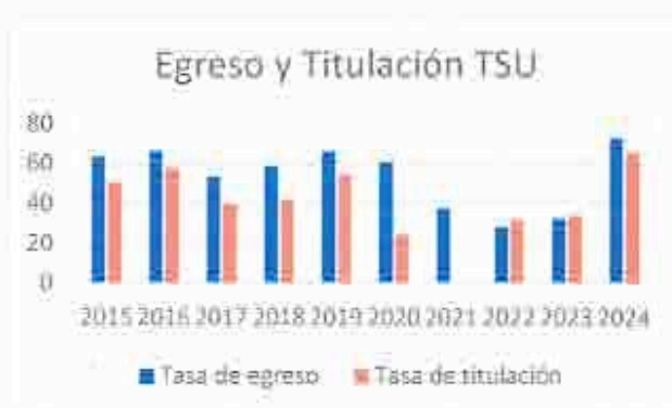
Figura 4. Egreso y titulación TSU

En el caso del nivel Licenciatura en el 2020 creció la tasa de egreso, pero se desplomó la titulación, producto del impacto económico de la pandemia que derivó en la necesidad de los alumnos de trabajar de manera inmediata una vez que culminaron sus estudios. Posteriormente se tuvo un repunte en estas cifras, al implementarse en el 2024 el programa de seguimiento y acompañamiento para titulación (tabla 7 y figura 5).