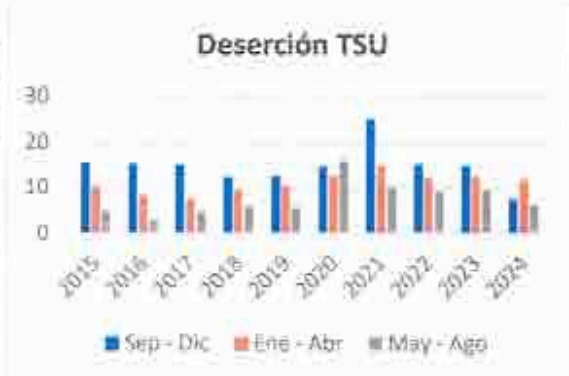
Figura 2. Deserción en TSU

En el caso de la Deserción nivel Ingeniería (tabla 5 y figura 3), el comportamiento de este indicador es similar al de TSU, una tendencia al alza en durante el periodo de pandemia, pero se registran cifras ala baja a partir del 2024.