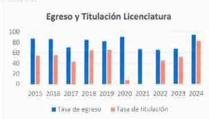
Figura 5. Egreso y Titulación Licenciatura

Se han realizado esfuerzos significativos para hacer frente a las limitaciones presupuestales; no obstante, los recursos actuales continúan siendo insuficientes. La Rectoría mantiene un firme compromiso con la estabilidad institucional y la atención de las necesidades prioritarias, por lo que resulta indispensable contar con ampliaciones presupuestales líquidas que permitan cumplir oportunamente con los compromisos laborales. Esta situación ha obligado a posponer tareas fundamentales, como el mantenimiento de la infraestructura y la actualización del equipamiento institucional.