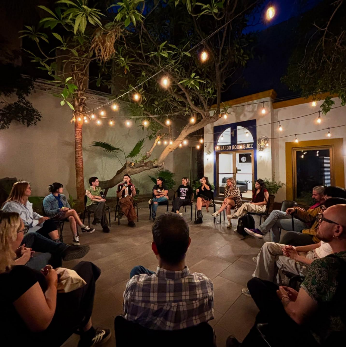
(Estreno del programa "Ética Cuir" en el patio de Radio Sonora)