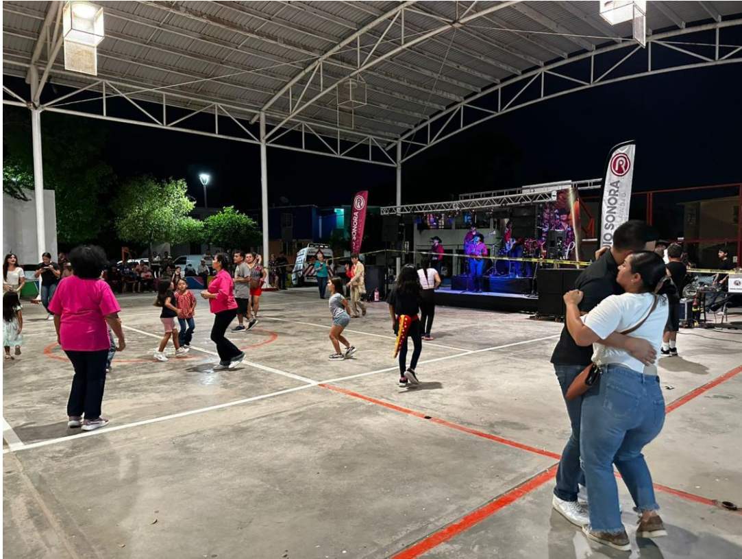
(Jueves de Plaza en la colonia Nuevo Hermosillo)

En el ámbito de la producción de contenidos, se incorporó el desarrollo de propuestas dirigidas a las infancias como eje creativo, a poblaciones en condición de vulnerabilidad, como la comunidad LGTBTTIQ+ y los pueblos originarios, además de fortalecer de manera transversal todos los contenidos con perspectiva de género.