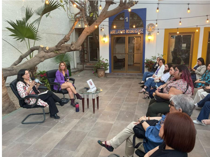
(Presentación del documental Rebeldes, Libres y Norteñas en el patio de Radio Sonora)