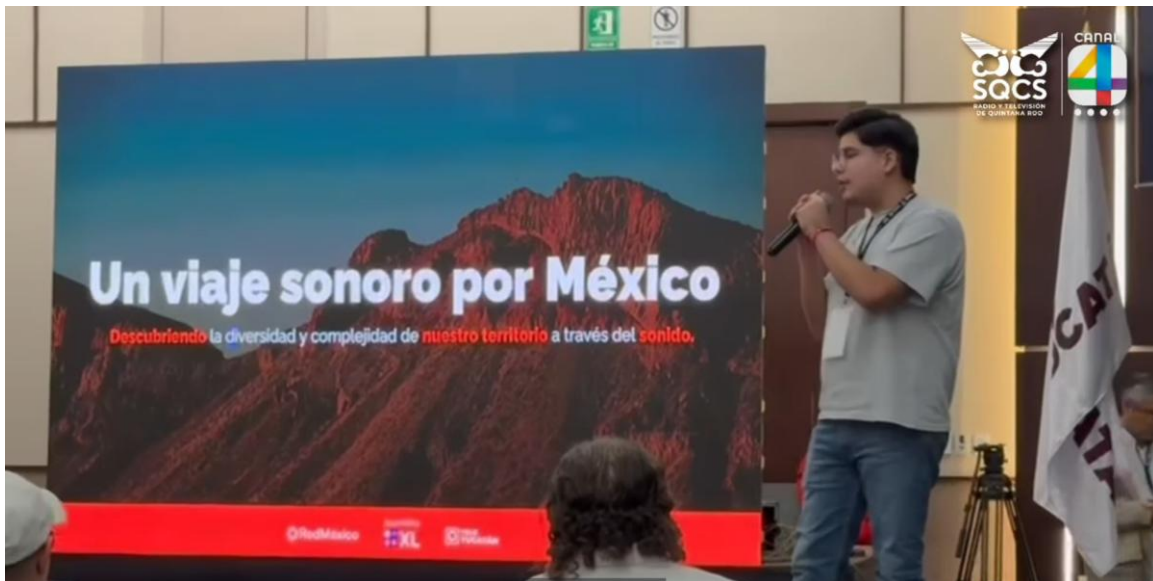
(Red México presentación del proyecto “Atlas Sonoro”)

Con estos resultados, se puede afirmar que la radio pública de Sonora se fortalece y consolida una línea de trabajo orientada a su transformación en un medio multiplataforma, pero sobre todo en una que ofrece servicios útiles para la comunidad, siempre preponderando el acceso a derechos bajo una visión humana.