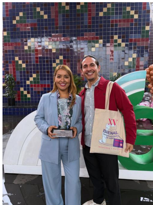
(XV Bienal Internacional de Radio, premiación del documental “Rebeldes, Libres y Norteñas en 3er lugar)