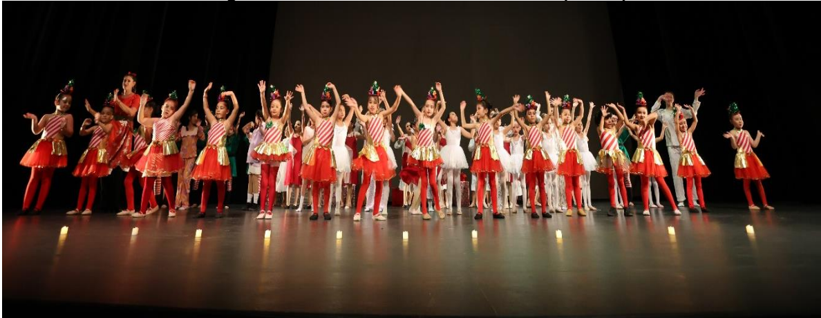
Fotografía 18. Cierre de Talleres Artísticos (Danza).