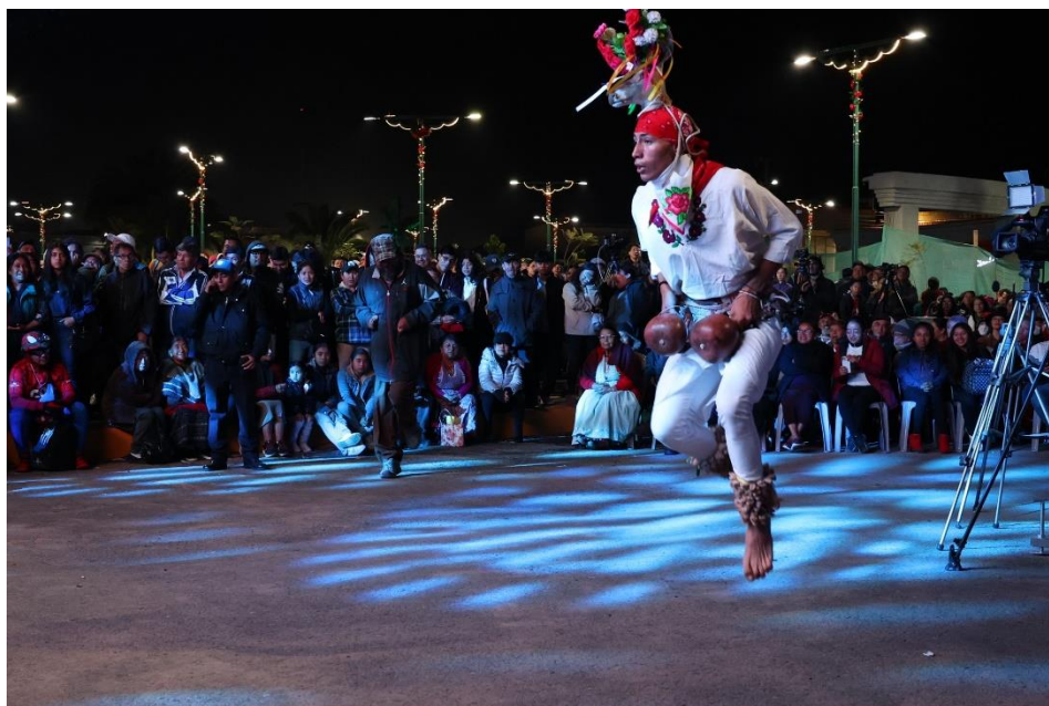
Fotografía 5. 500 años de la fundación de Quetzaltenango, Guatemala, Representación Oficial de la “Danza del Venado”